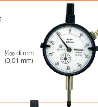
1/100 di mm (0,01 mm)

Tipo con lettura 1/1000 di mm (0,001 mm)