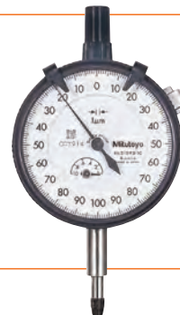
1/1000 di mm (0,001 mm)