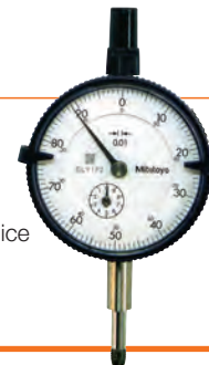
1/100 di pollice (.001")

Tipo con lettura 1/100 di pollice (.001")