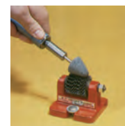
Esempio di utilizzo

Serie di rotelle di ricambio - Larghezza fascia 35 mm